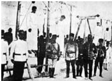
Türkisches Massaker in Armenien (ca. 1916): 600.000 bis 1,5 Millionen Opfer

Legendär sind auch die Telefonanrufe nach Dinks TV-Auftritten, in denen Türken ihre bislang verheimlichten armenischen Wurzeln offenbaren. Andere berichten von Spuren armenischen Lebens in ihren Orten und bitten um seine Hilfe für die Bewahrung dieses kulturellen Erbes. Selbst Bewohner eines ganzen Dorfes standen schon einmal in seiner Redaktion: Nachfahren türkischer Armenier, die 1915, zur Zeit der schlimmsten Verfolgung, bei ihren alevitischen Nachbarn in der Region Tunceli (Dersim) Schutz gefunden hatten.