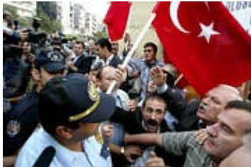
Proteste gegen Armenien-Konferenz (am 24. September in Istanbul): Erdogan konnte das Schlimmste verhindern

Für einen Teil der armenischen Diaspora und auch so manchen engstirnigen Türkei-Kritiker in Europa ist er der "Widerspruch in Person", es dürfte ihn eigentlich gar nicht geben: Hrant Dink, ein Armenier in der Türkei, der die türkische Demokratiebewegung aktiv unterstützt und in der EU-Annäherung die Chance zur Versöhnung mit der eigenen Geschichte sieht. Jemand wie Dink sitzt zwischen allen Stühlen.