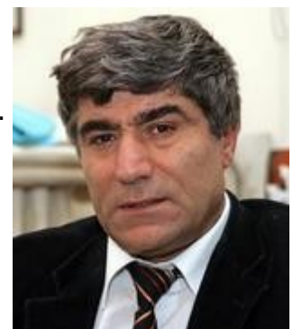
Redakteur Dink: "Wir wissen, was passiert ist"

Das schmeckte den Ultra-Nationalisten erwartungsgemäß gar nicht. Während diese also zahlreich draußen vor den Türen des Konferenzentrums ihr demokratisches Recht auf freie Meinungsäußerung wahrnahmen, wollten sie gleichzeitig jenen, die drinnen redeten, das gleiche Recht verwehren. Diese Schizophrenie wird die Türkei noch eine